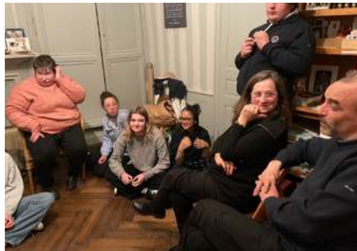
Le partage en petit groupe