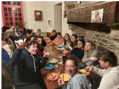
Les frites au rendez-vous