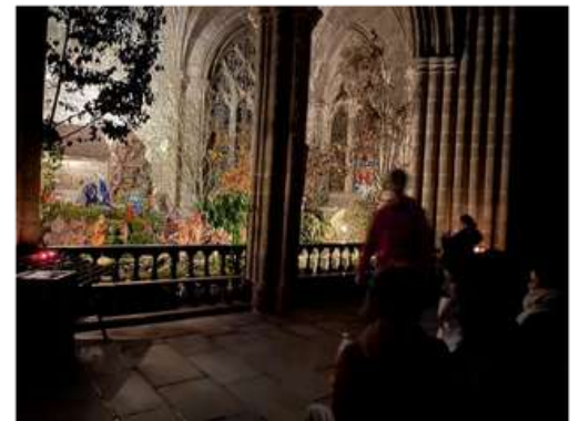
Le temps de prière devant la magnifique crèche