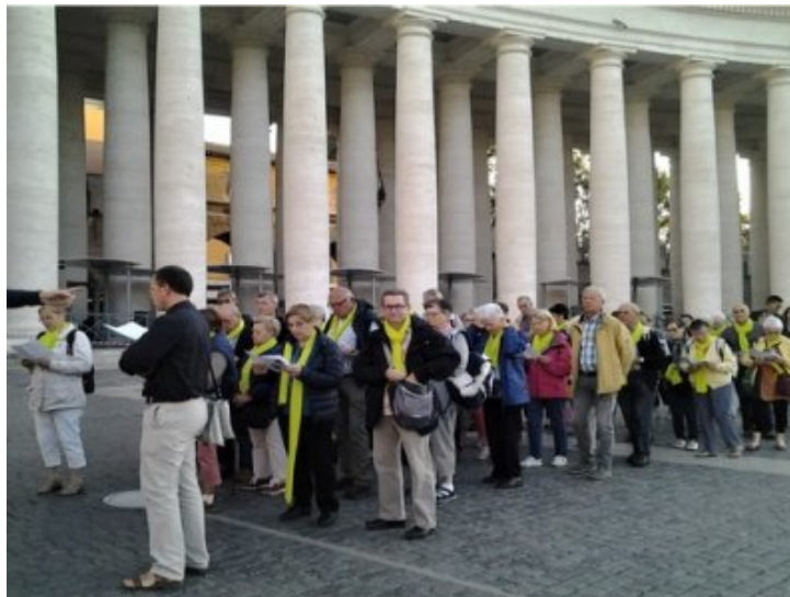
Notre groupe sur la Place St-Pierre

L'entrée sur l'esplanade se fait après avoir montré patte blanche : portiques, contrôles- sécurité oblige. Pendant ce temps, nous chantions à gorge déployée les 24 couplets du chant à saint Pierre de nos paroisses.