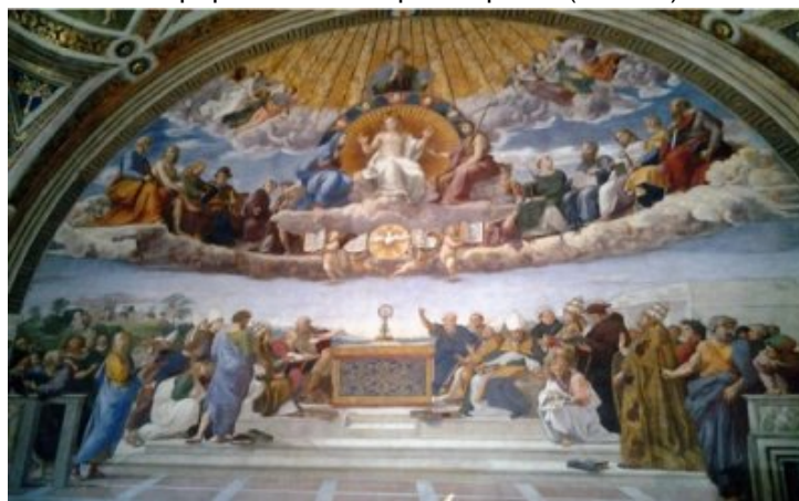
Des fresques spectaculaires !

L'après-midi a été consacré à la visite des Musées du Vatican. Je ne peux énumérer toutes les merveilles qui s'y trouvent. Juste un petit aperçu : la galerie géographique, la galerie des tapisseries, des statues magnifiques, les chambres des appartements de certains papes décorées par Raphaël (Jules II).