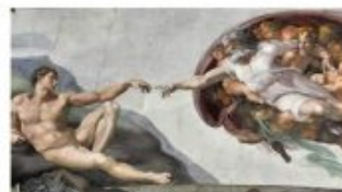
Vues de la chapelle Sixtine

La chapelle fut construite de 1475 à 1481 sur l'ordre du pape Sixte IV qui fit venir des peintres florentins qui ornèrent les parois latérales. Plus tard, les papes suivants confièrent à Michel-Ange le soin de peindre la voûte (Jules II) et Clément VII et Paul III pour la paroi au-dessus de l'autel. Nos guides nous racontèrent de nombreuses anecdotes liées à ces travaux qui ont pu être contestés en leur temps. Lieu de réunion des conclaves, théâtre des cérémonies les plus solennelles du Saint-Siège, la chapelle Sixtine est un chef-d'oeuvre de l'art de la Renaissance.