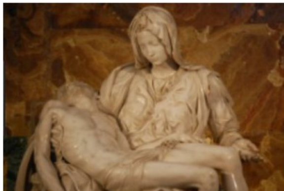
La Pietà de Michel-Ange

Nous avons ensuite été admirer la Pietà de Michel-Ange. Un chef-d'oeuvre que l'artiste exécuta lorsqu'il n'avait que 25 ans (1499). La Vierge a un visage extraordinairement jeune, mais il y a dans son regard une résignation pathétique devant le corps si meurtri de son Fils. C'est l'humanité avec toutes ses souffrances, atteinte par le mal, que Marie, figure de l'Église, accueille.